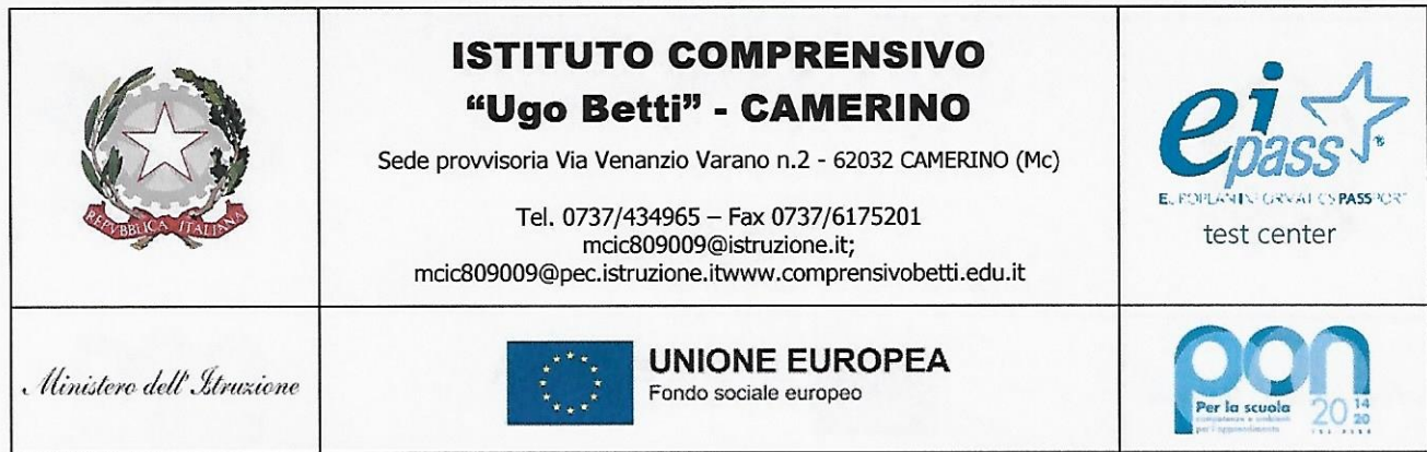
Figura professionale: ESPERTO COLLAUDATORE